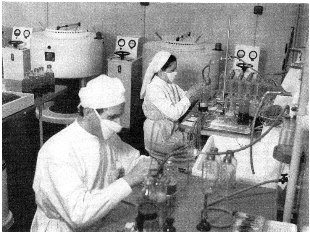
En bas, la salle des appareils centrifuges et la récolte du plasma.