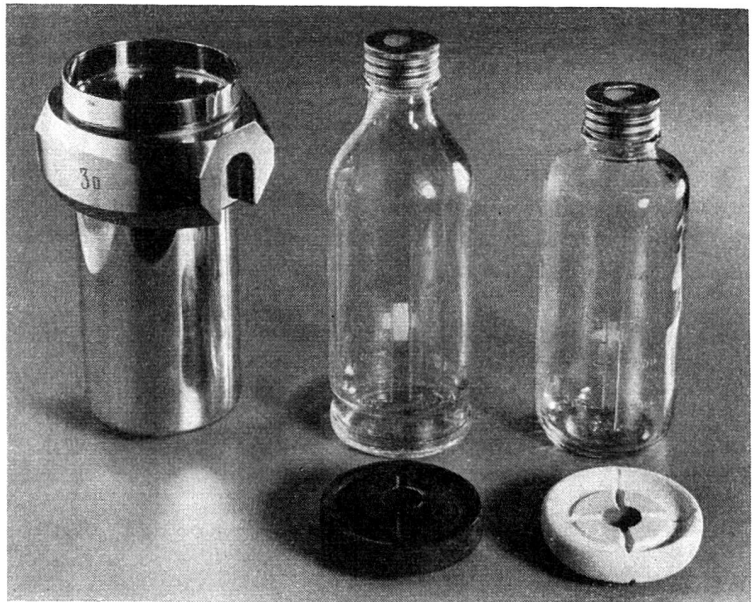
En haut, le porte-bouteilles d'un appareil centrifuge avec des bouteilles à sang et à plasma.