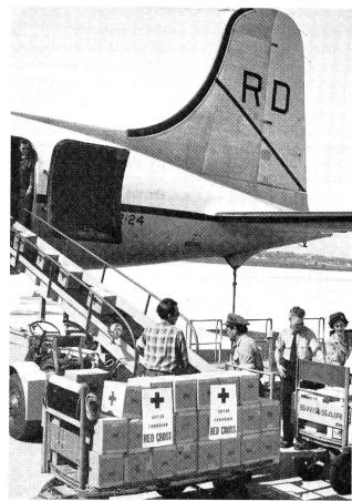
De l'aéroport de Cointrin, des secours de la Croix-Rouge ont été envoyés immédiatement en Grèce.

Le Comité central a voté un crédit de fr. 5700 pour l'achat de 100 matelas et un crédit de fr. 4000 pour du matériel destiné aux cours samaritains.