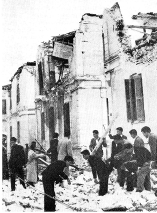
La catastrophe de Volos où un tremblement de terre a détruit cette ville de 70 000 habitants.