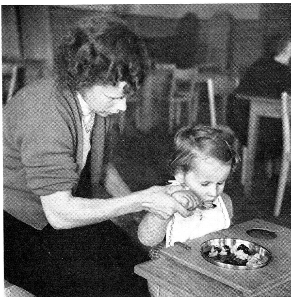
Apprendre à l'enfant à manger seul demande de la patience. Une planchette spéciale y aide. La mère guide d'abord la main de l'enfant.

Suivant la localisation de ces lésions, certaines parties du corps sont atteintes de paralysie crispée , ou d' athétose ; on constate en