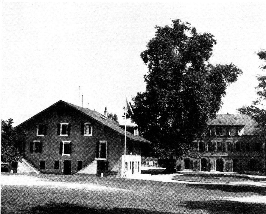
La Maison des Charmilles, maison de rééducation genevoise pour enfants difficiles ou inadaptés.

L'esprit pratique des Américains ne s'est pas trompé sur ce point (ils vont certes un peu loin dans leur sens