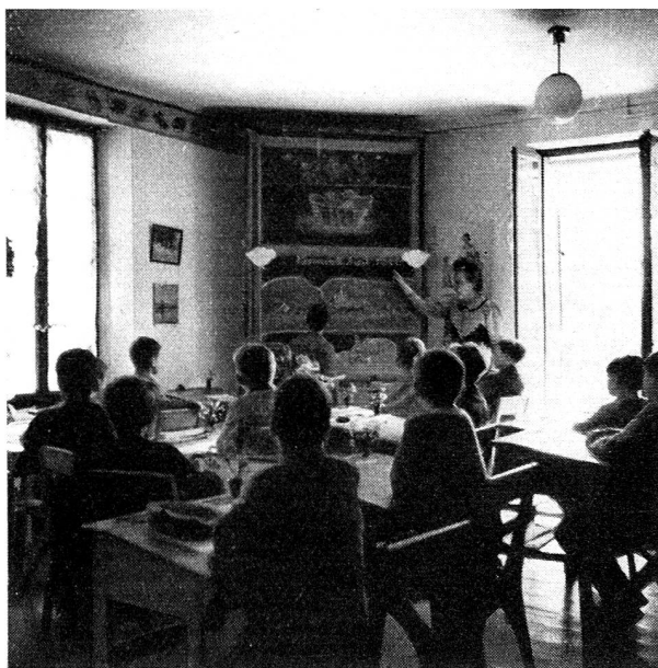
Une classe à la Maison des Charmilles.

Un autre devoir incombe aux directeurs: non seulement se prêter de bonne grâce aux inspections que peuvent légitimement désirer les autorités de placement, mais tenir d'eux-mêmes celles-ci au courant de l'évolution du jeune qui leur a été confié. Cette information périodique par une sorte de petit «bulletin de santé» est infiniment souhaitable. Certes, les directeurs sont débordés d'occupations. On ne saurait trop le dire: ils sont écrasés. Mais s'ils savent s'entourer de collaborateurs compétents, aux personnalités qui se complètent, s'ils peuvent en obtenir, de leurs administrateurs, un nombre suffisant, s'ils les réunissent en «conseil de maison» pour solliciter leurs avis, s'ils parviennent à n'exécuter eux-mêmes que fort peu de tâches, pour demeurer le «chef d'orchestre», le contrôleur, le régula-