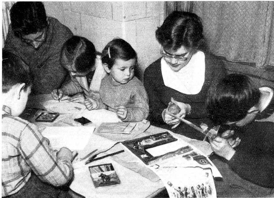
A la garderie d'enfants organisée en décembre par des « juniors » neuchâtelois.

sins malades, faire le ménage d'un infirme. De nombreux albums, confectionnés à la maison, ont été adressés à l'étranger. En retour, nous en avons reçu d'autres qui venaient avec bonheur illustrer nos leçons de géographie. Pour Noël, les enfants ont confectionné de petits paquets pour un asile de vieillards; ils sont allés, par petits groupes, chanter chez les isolés, autour d'une branche de sapin illuminée. Pour couvrir les frais, on a élevé des lapins qui se vendent fort bien. D'ailleurs, les frais de correspondance ont considérablement baissé depuis notre adhésion à la Croix-Rouge de la Jeunesse, puisque nos