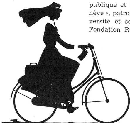
1905 - 1955 Quatre silhouettes illustrant la plaquette du cinquantenaire du Bon Secours.

Elle fut suivie, le soir, d'une réception offerte par le Conseil d'Etat et le Conseil administratif genevois au Bon Secours et à ses invités et invitées. Un culte liturgique de Sainte-Cène eut lieu le dimanche à la cathédrale de Saint-Pierre. Une soirée réunit encore toutes celles qui étaient accourues presque du monde entier pour s'associer à la joie de leur vieille école, où fut représentée une revue du cinquantenaire.