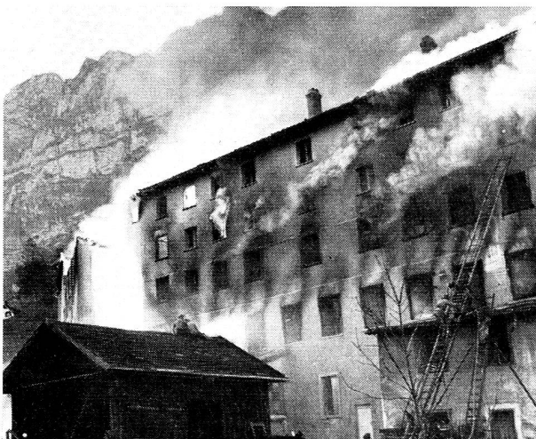
Le tragique incendie de Riedern.

A la Croix-Rouge autrichienne de Linz: 5779 kg de literie, ustensiles de ménage, pour une valeur de fr. 34 537.—;