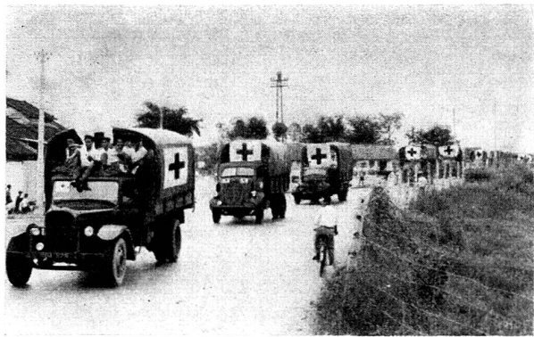
Une colonne de 46 camions porte des secours aux réfugiés dans le Sud-Vietnam.

Une des dirigeantes du Bureau de la Croix-Rouge de la Jeunesse de la Ligue des sociétés de la Croix-Rouge