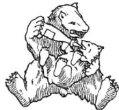
Marque à l'Ours