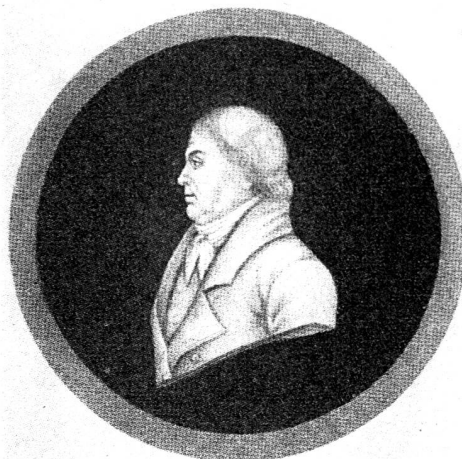
Friederich-Anton Mesmer, d'après une gravure parue en 1814.

Il peut, en effet, paraître curieux de montrer comment les savants du XVIII e siècle ont tenté de réaliser à peu près toutes les techniques qui sont aujourd'hui employées quotidiennement, à part, bien entendu, celles qui font appel à la haute fréquence, puisqu'à l'époque, on ignorait même le courant électrique; de montrer ces hommes essayant de mettre en pratique des idées souvent fort en avance sur leur temps, mais en étant