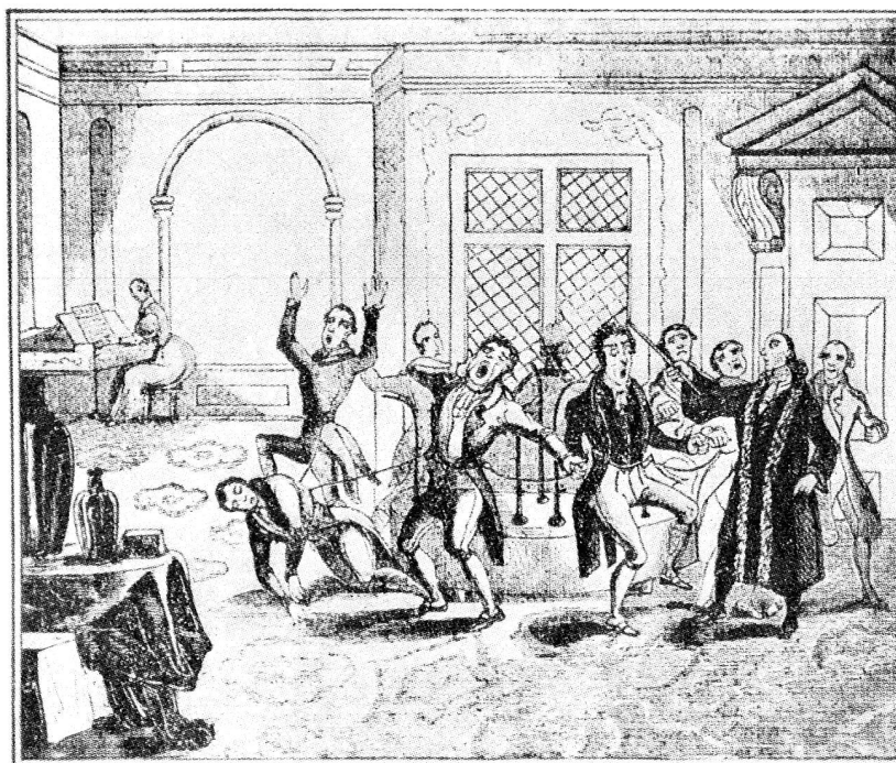
Le célèbre « baquet » de Mesmer, d'après une caricature anglaise du XVIII e siècle.

Leur appareillage misérable a donc empêché les savants du XVIII e siècle de progresser aussi vite qu'ils l'eussent voulu; peut-être cela a-t-il été un bien car, s'estimant en parfaite sécurité,