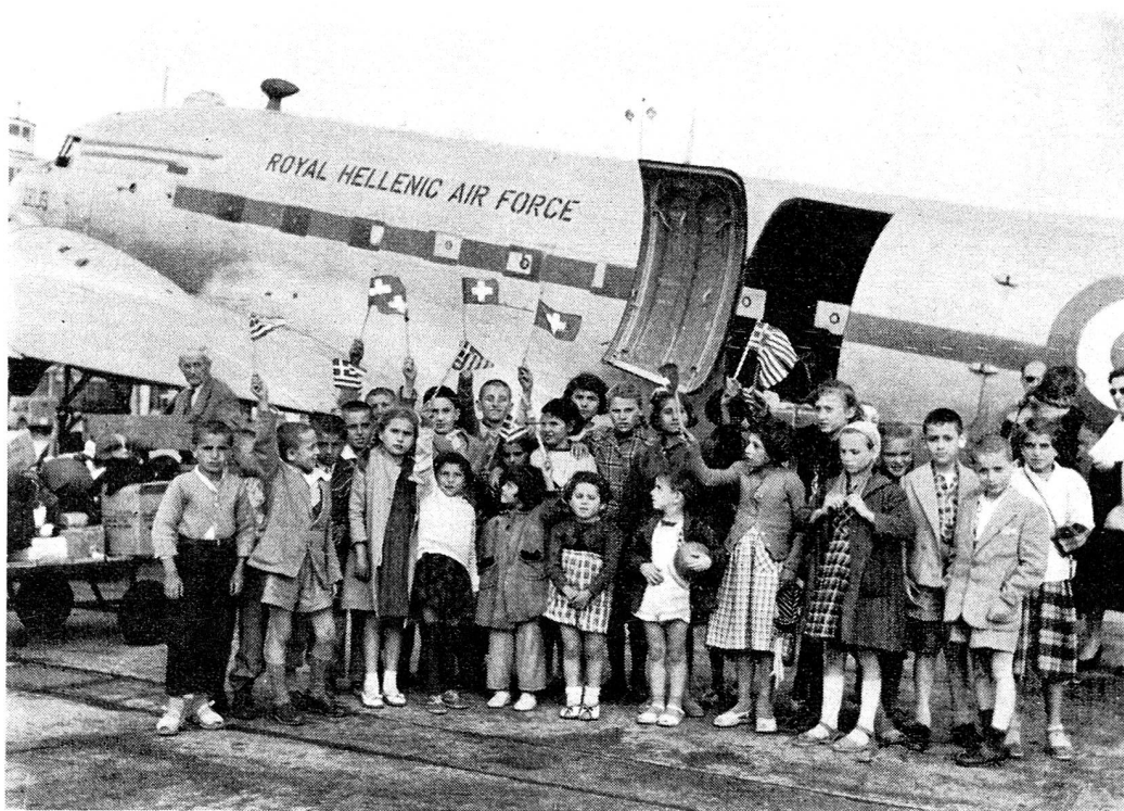
L'arrivée à l'aéroport de Genève du premier avion militaire amenant les enfants grecs en Suisse.