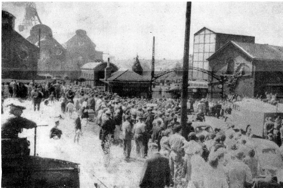
La catastrophe de Marcinelle, devant l'entrée de la mine.

A la suite des graves inondations qui ont ravagé l'Iran, la Ligue des sociétés de la Croix-Rouge avait lancé, le 3 août, un appel international en faveur des sinistrés.