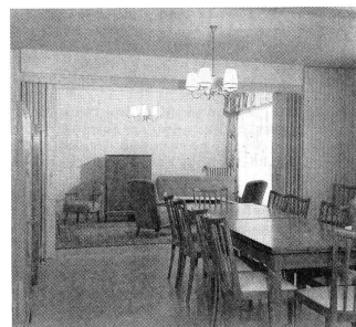
Au nouveau foyer de La Source.

Une inauguration avec les Sourciennes a eu lieu le 19 novembre.