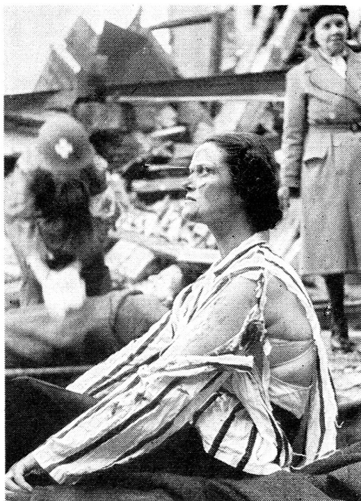
Les exercices d'entraînement de protection aérienne sont faits en Suède avec un réalisme dont cette photo donne un exemple.

La guerre est en fait un objet du droit des gens . Au cours des cent dernières années, de nombreux accords internationaux ont été rédigés et ratifiés, dans le but de mettre des bornes à la cruauté et au déchaînement de la guerre. Les puissances qui, en 1864, ont signé la « Convention de Genève pour l'amélioration du sort des blessés dans les armées en campagne » étaient « animées du désir d'adoucir les maux inséparables de la guerre, de supprimer les rigueurs inutiles et d'améliorer le sort des