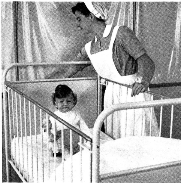
« Face à la vie »

de la Croix-Rouge suisse, au même titre que l'ASID, et qui doit également fournir à l'armée du personnel auxiliaire qualifié pour les hôpitaux et les trains sanitaires militaires.