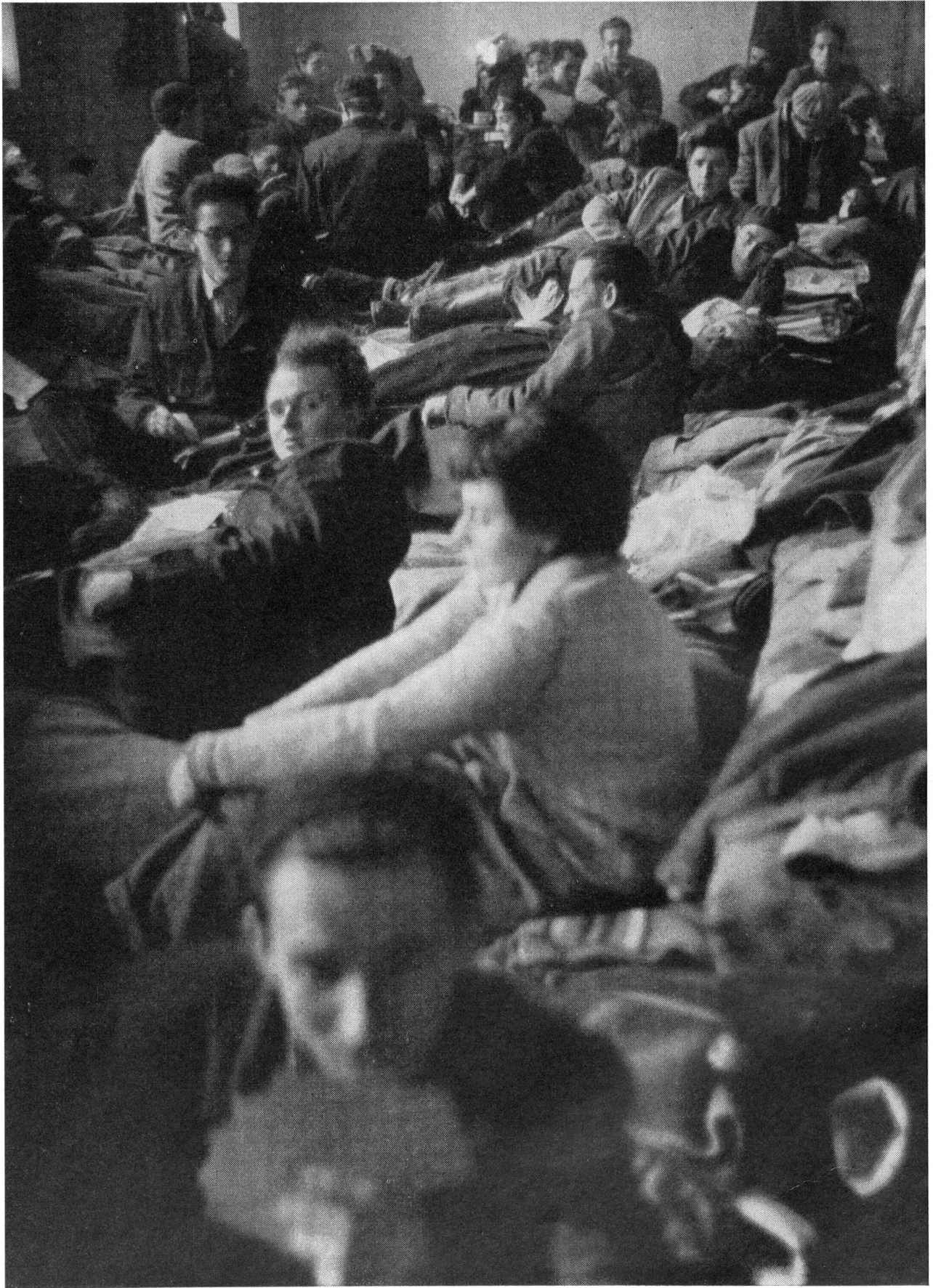
Un des camps provisoires d'accueil en Autriche où ont été accueillis plus de cent mille réfugiés hongrois.