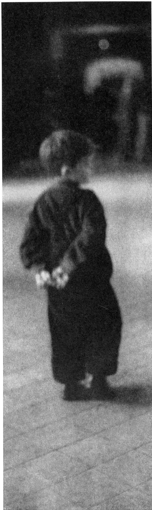
Dans un camp en Autriche, un petit réfugié hongrois...