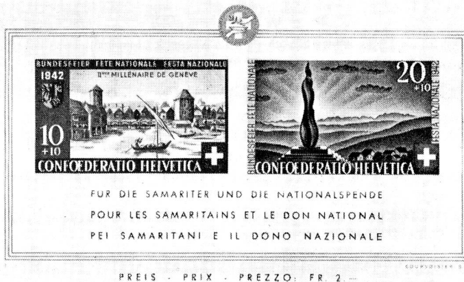
Bloc B. 1

intéressant les Sociétés auxiliaires de la Croix-Rouge suisse