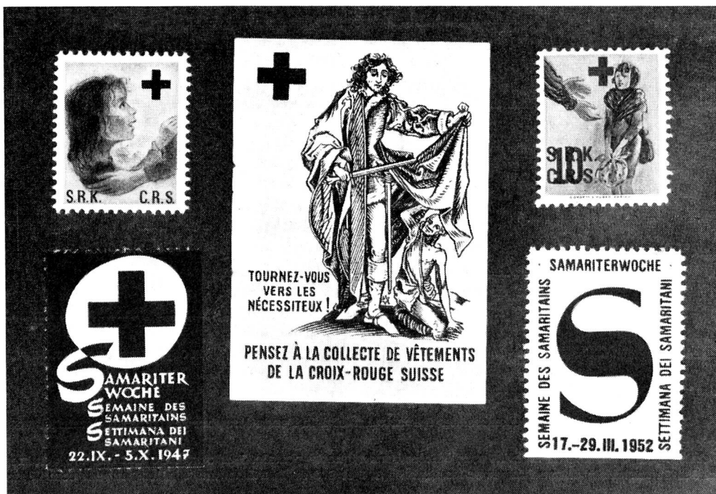
En haut: Vignettes croix-rouge V. 2, V. 3 et V. 1. En bas: Vignettes samaritaines V. 1 et V. 3.