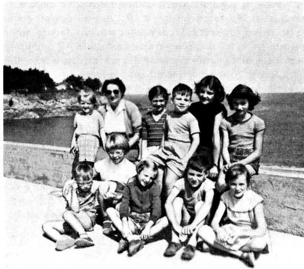
Un groupe d'enfants de Martigny à la colonie de vacances de Rotheneuf près de St-Malo.

Particolarmente interessante l'azione iniziata per raggruppare in una Federazione tutte le opere di assistenza sociale esistenti nel bellinzonese, azione partita