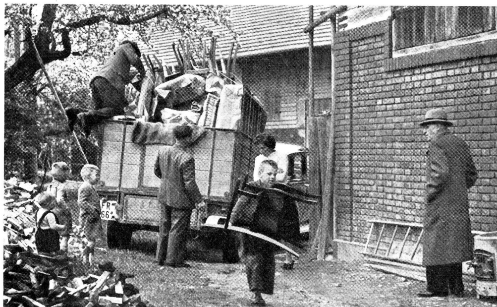
Celle-ci met à disposition le mobilier et la literie indispensables aux sinistrés qui ont tout perdu. Un voisin prête sa camionnette, le mobilier peut être remis aux sinistrés par la Croix-Rouge fribourgeoise. Les aînés des huit enfants aident au déchargement.

La section croix-rouge de Porrentruy s'est réorganisée et a complété son comité au début de l'an dernier. Elle a fourni un gros effort également en faveur des réfugiés hongrois — deux prises de sang collectives,