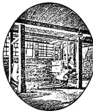
Exposition Nationale Berne 1914 Médaille d'or (collective)

Fabrication de toiles bernoises faites à la main et à la machine, tissus en pur lin, mi-fils et en coton.