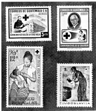
Nouveaux timbres croix-rouge du Guatemala, du Laos et de Yougoslavie.