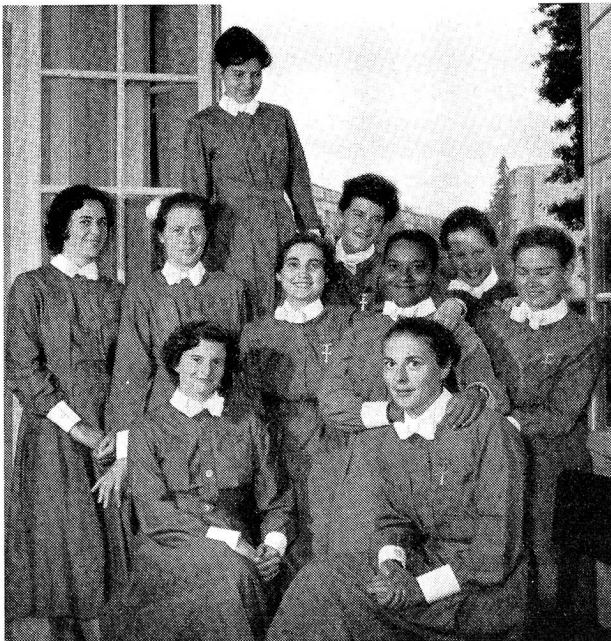
Une nouvelle volée d'infirmières se prépare à aller de l'avant.

Pour la candidate suivante, c'est une affection cardiaque que le sort — toujours lui — veut qu'elle traite. Certes, les maladies du cœur sont compliquées. L'infirmière en sait ce qui est utile pour son service. Mais à côté de tous les mystères de la circulation, et sachant aussi qu'un cœur peut être compensé ou décompensé et ce que cela signifie en réalité, elle ne doit pas non plus oublier la balance. La prosaïque balance dont sa patiente d'aujourd'hui aura besoin dès demain, lorsqu'elle aura regagné son domicile. Connaître les signes précurseurs d'un œdème pulmonaire, fort bien, mais savoir également chez qui on peut la louer cette balance. Et la malade cardiaque dont vous avez à vous occuper habite