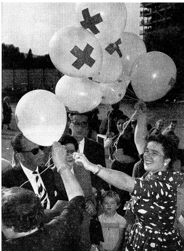
Un lâcher de ballonnets porteurs de messages croix-rouge a eu lieu à la Saffa à Zurich.

Prima di sentire ciò ch'è avvenuto dei nostri 115 palloni, vorremmo però sapere cosa hanno fatto pel cielo blu, prima di arrivare al termine del viaggio? Ma questo è il loro segreto. E non lo avremmo mai saputo se alcuni fra loro non fossero dei chiaccheroni... Ma perchè, in fin dei conti, questi palloni si sono diretti proprio tutti verso il Sud, piuttosto che verso la Germania, l'Austria, oppure la Svizzera occidentale? Adesso