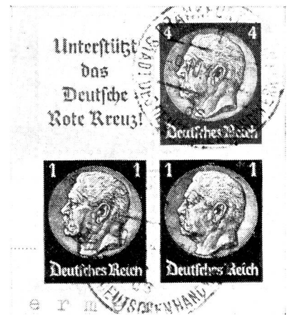
T. 1 et T. 2