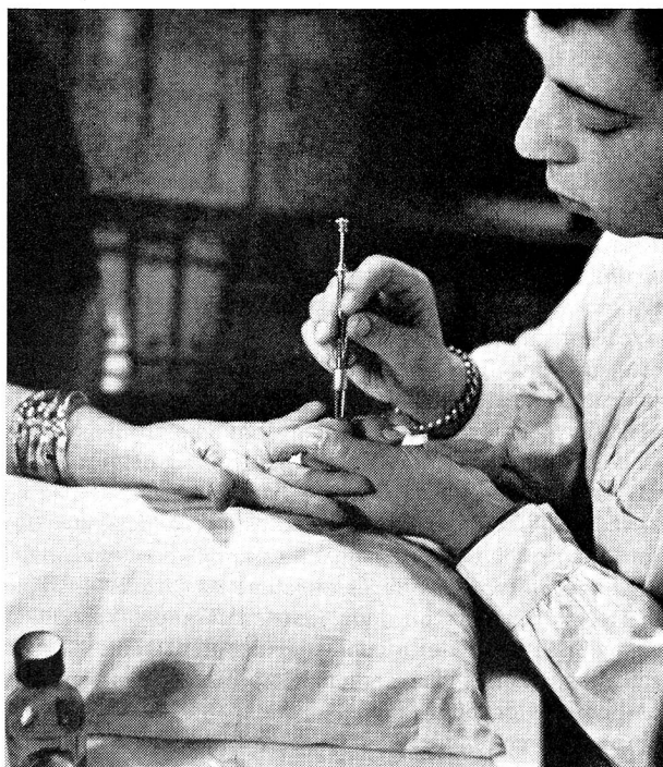
Prise de sang pour la détermination du sang.

On part. On est parti. Il neige sur Lausanne, il neige sur tout le pays de Vaud. Prudente, l'auto roule dans