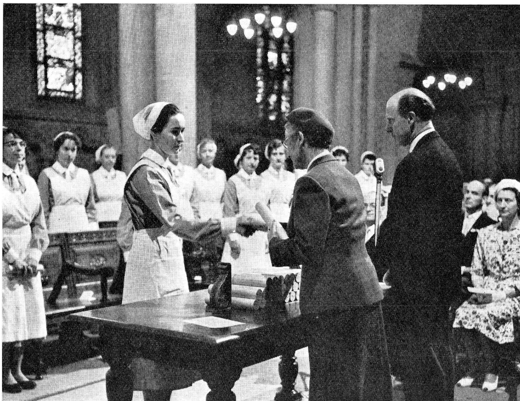
La remise des diplômes à la promotion du centenaire

Puis de nombreux délégués des écoles d'infirmières de Suisse et de l'étranger remirent des adresses et présentèrent leurs vœux à la directrice de « La