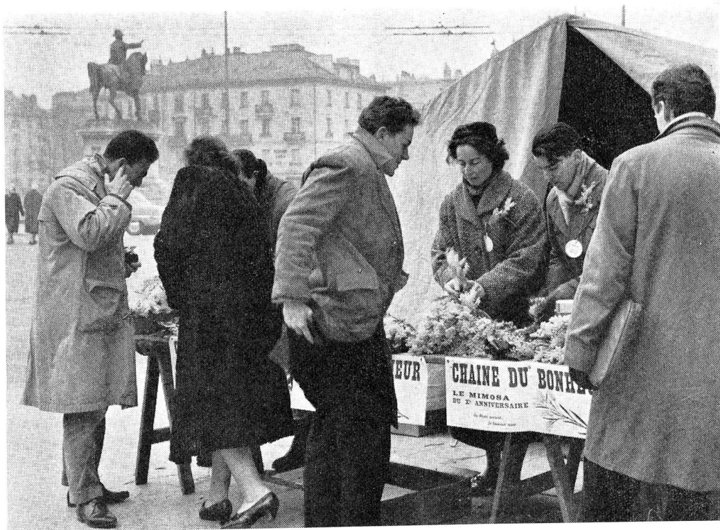
Mimosa 1959... Mimosa des enfants.

La Chaîne du Bonheur a fait le tour du monde Sa ronde recommence sans se lasser jamais, Alors que sa voix claire retentit sur les ondes « Papous » hâtons-nous donc de fleurir nos chalets.