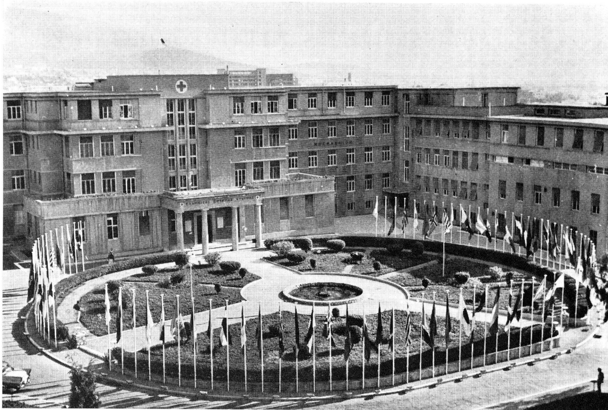
L'hôpital et l'école d'infirmières de la Croix-Rouge hellénique à Athènes où s'est tenue la XXV e session du Conseil des gouverneurs de la Ligue.