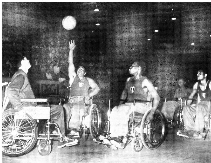
Partie de basket-ball disputée par deux équipes de handicapés au cours de la manifestation de « Sport-Handicap »

Depuis lors, il est vrai, en Suisse comme dans le monde entier, un travail considérable s'est fait pour permettre de réintégrer le plus et le mieux possible dans la communauté ceux qui, trop longtemps, ne furent guère considérés que comme de malheureuses épaves. Au devoir humain qui s'impose vis-à-vis de ceux de nos semblables que le sort a frappés dans leur intégrité physique, s'ajoutait également l'aspect social et économique du problème. De plus en plus, la société contemporaine, devant les charges écri-