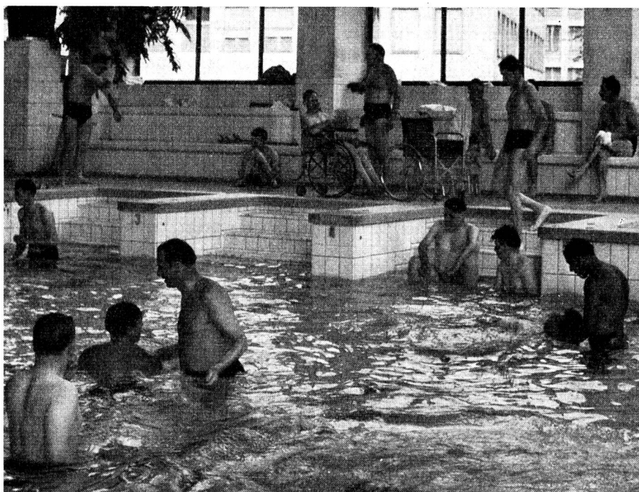
Cours de natation pour invalides à Zurich sous la direction d'instructeurs qualifiés (Cliché de la Fédération suisse pour l'intégration des handicapés)

Le lecteur peut se poser à ce propos une question encore. Quelles sont, se demandera-t-il peut-être, les disciplines sportives ouvertes le plus aisément aux invalides? Si la manifestation genevoise de « Sport-Handicap » avait choisi pour sa première démonstration, le basket , le tennis de table et le tir à l'arc , c'est que ces trois sports constituent l'essentiel des jeux d'un hôpital spécialisé en rééducation et qui organise chaque an une rencontre internationale pour paraplégiques, celui de Stoke Mandeville en Angleterre. En même temps qu'un exemple de ce que sont ces journées anglaises, la manifestation de « Sport-Handicap » permettait d'organiser sur