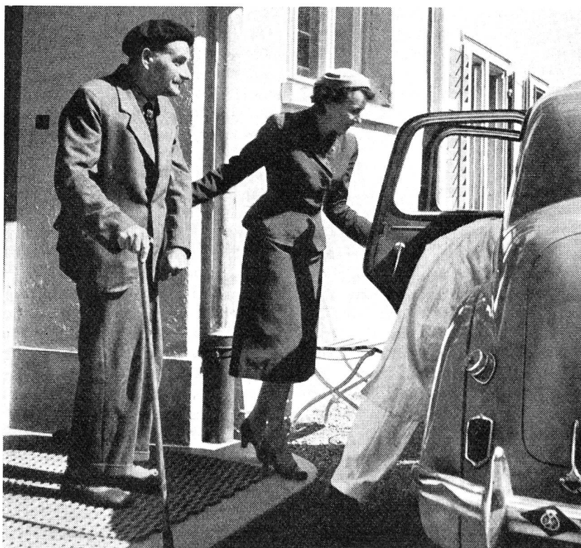
L'aide aux isolés et aux vieillards peut prendre cent chemins... et même la grand'route!

Jusqu'ici, les assistantes bénévoles de la section de Stans n'ont déployé leur activité qu'à Stans, localité