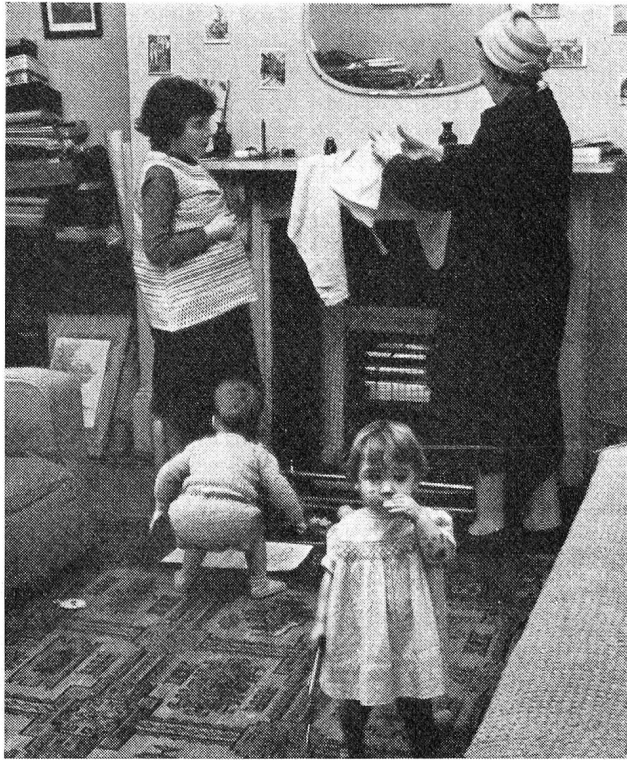
Les dangers domestiques. Une visiteuse d'hygiène, en Angleterre, montre à la mère le danger de mettre sécher des linges à proximité d'une cheminée (O. M. S.)

« Perdre du temps » à fermer un compteur électrique avant de changer un plomb, essuyer tout de suite une tache de graisse sur le carrelage de la cuisine, entrouvrir la fenêtre de la pièce où brûle un poêle à gaz ou à charbon: chacun de ces gestes élimine un des pièges qui empêchent la maison d'être pour tous ses habitants un véritable abri.