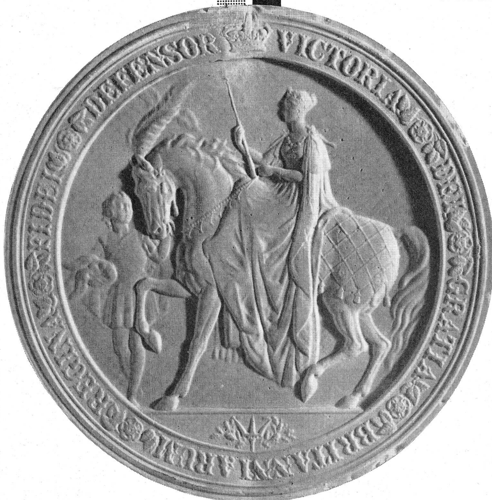
Sceau apposé sur un brevet anglais datant de 1868

Fidèle à une longue tradition, CIBA bâtit sa renommée sur les succès de la recherche scientifique dans les divers secteurs de son activité.