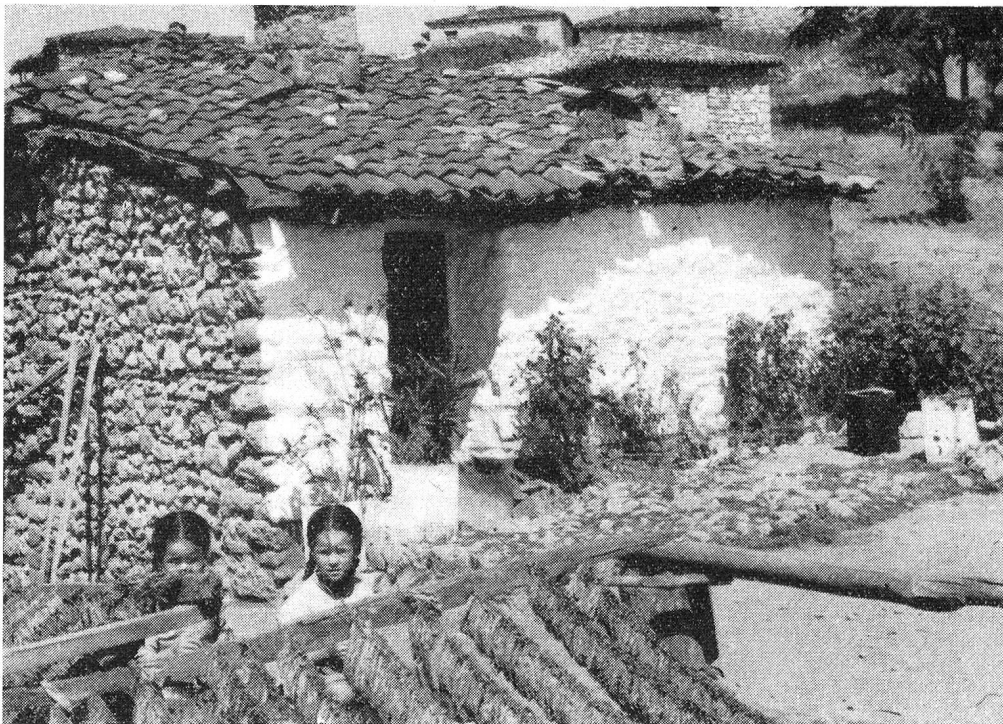
Tout le jour, les enfants piquent les feuilles de tabac sur de longs fils...

Nous longeons l'ancienne voie sacrée qui mène à Eleusis et qu'empruntaient jadis les pèlerins se rendant aux Mystères. Voici le lac où ils se purifiaient avant d'arriver aux lieux saints. A quelques kilomètres, se dressent aujourd'hui les cheminées de la raffinerie de pétrole d'Eleusis, qui n'est plus qu'une bourgade industrielle. De la plus haute s'échappe une flamme, étrange flambeau qui brûle jour et nuit. Et nous quittons la