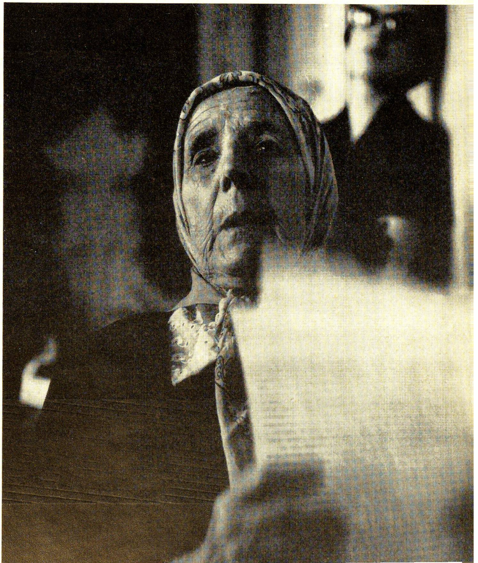
Le visage pathétique d'une réfugiée qui a trouvé asile en Suisse.