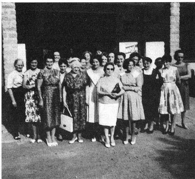
Rossa (Calanca), settembre 1961

Ci vollero alcuni anni, e la prima conoscenza rudimentale del dialetto, per chiarire il mistero: infatti la popolazione incontrando il medico gli diceva, certo con