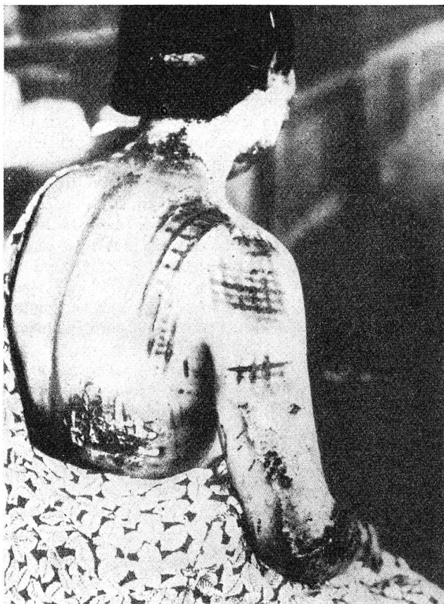
Brûlures provoquées par l'explosion d'une bombe atomique. Le dessin de la chemise s'est marqué sur la peau

pier sait jusqu'où il peut aller, et sait que dépasser certaines limites tiendrait du suicide, du suicide inutile d'ailleurs puisque rien de vivant n'a pu se maintenir au-delà de cette limite. Dans le bombardement d'Hiroshima (et peut-être est-ce là un des plus grands dangers) rien n'indiquait la limite au-delà de laquelle tout séjour était forcément mortel; bien des sauveteurs l'ont dépassée par ignorance et sont tombés victimes de leur zèle.