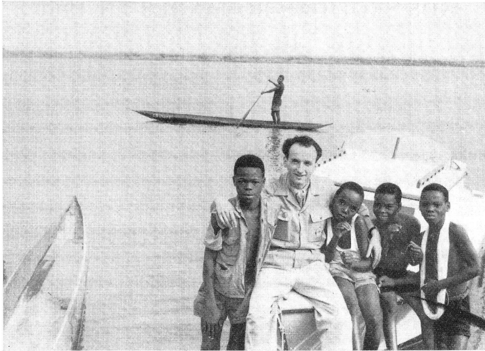
Tout n'est pas que misère et deuil au Congo, heureusement. Preuve soit du sourire confiant de ces enfants congolais qui ont trouvé un grand ami chez un membre de la mission suisse à Léopoldville