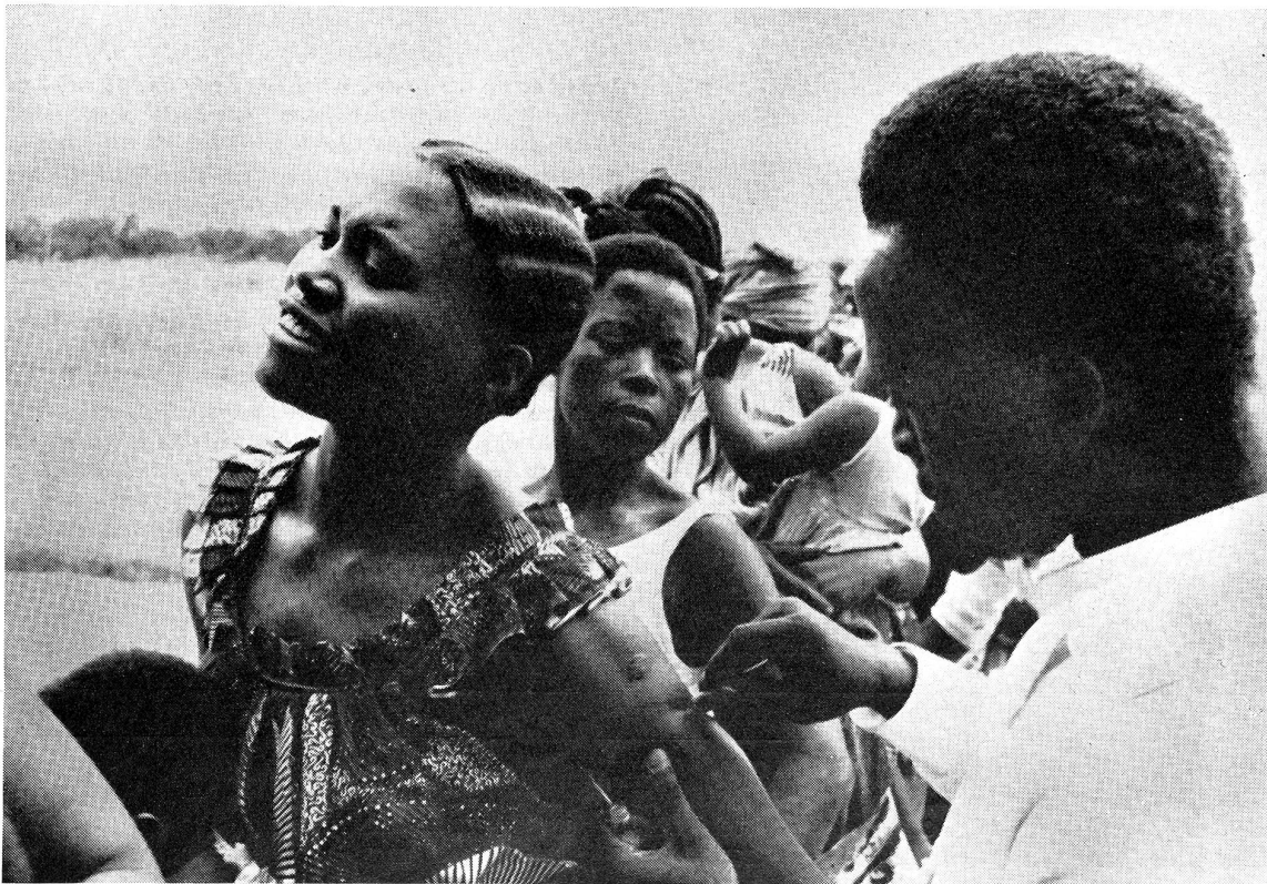
Vaccination à Léopoldville par un assistant de l'hôpital de Kintambo (février 1962)

Il me souvient de ce voyageur arrivant malade l'année dernière en droite ligne de l'Inde où sévissait le choléra, sans qu'on lui demande même un certificat de vaccination à l'aéroport d'Europe dans lequel il débarquait