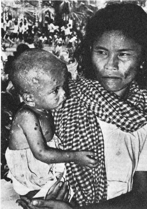
Une femme et son enfant atteint de variole, photo prise par un médecin de l'O. M. S. dans un marché asiatique