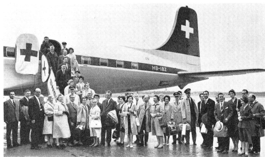
L'embarquement à Coitrin le 4 mai pour Oujda et Tunis