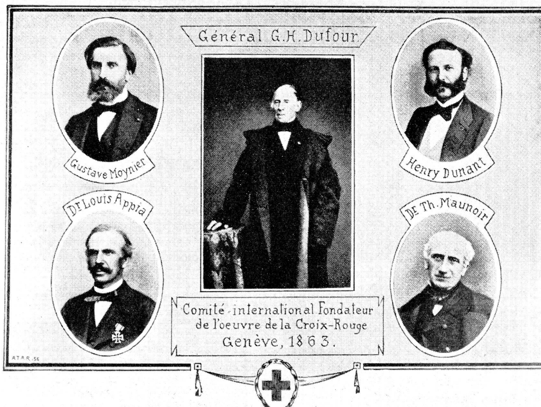
Le Comité des Cinq. (Document reproduit avec l'autorisation de la Bibliothèque publique et universitaire de Genève)