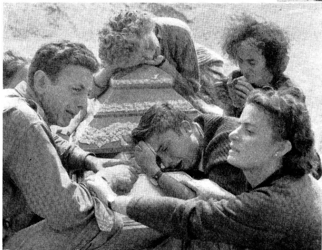
Au lendemain de la catastrophe...