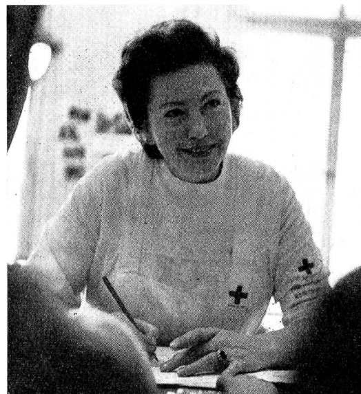
Un matin chaque semaine, cette auxiliaire-hospitalière de la Croix-Rouge accueille les nouveaux malades à leur arrivée à l'Hôpital de l'Île à Berne et facilite leur entrée

Il nous tient particulièrement à cœur que cet intérêt ne soit pas uniquement mis en éveil lors du lancement de quelque action de secours consécutive à une catastrophe et dont il est question dans les journaux, mais qu'il se porte aussi sur le travail effectué jour après jour, dans notre propre pays. Nous sommes certains qu'une connaissance exacte de l'activité de la Croix-Rouge suisse éveillera chez beaucoup — qu'ils soient ou non membres de notre société — le désir de collaborer également à ce travail. La Croix-Rouge suisse espère gagner l'adhésion de nombreux membres et collaborateurs bénévoles et j'esquisserai rapidement les possibilités de participer à l'œuvre de la Croix-Rouge suisse.