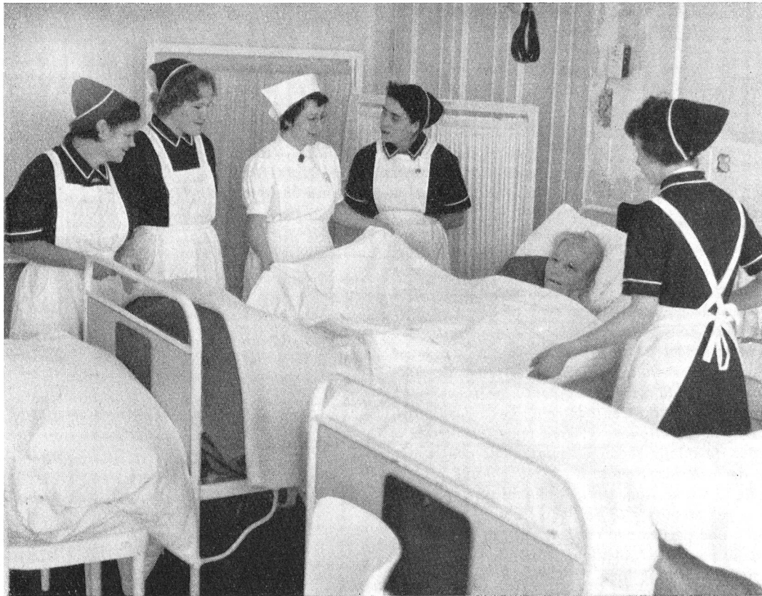
Sept écoles — dont une à Lausanne — forment des aides-soignantes qui rendent de précieux services auprès des malades chroniques ou des vieillards. La formation est de 18 mois et comprend 240 heures d'enseignement théorique.

Notre époque, caractérisée par la pleine occupation, le bien-être général, le nombre croissant des automobiles et l'exiguïté des appartements est une période favorable pour les bien-portants mais souvent plus difficile pour les personnes âgées et impotentes. L'on n'a ni temps ni place pour eux. Certes, des mesures de pré-