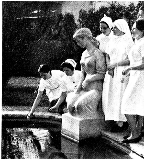
Dans le jardin de «La Source», les nouvelles infirmières de salle d'opération.

Pour la première fois en Suisse, un cours pour infirmières de salles d'opération d'une durée de six mois vient de se dérouler sous les auspices de l'Ecole romande d'infirmières de la Croix-Rouge suisse «La Source», à Lausanne.