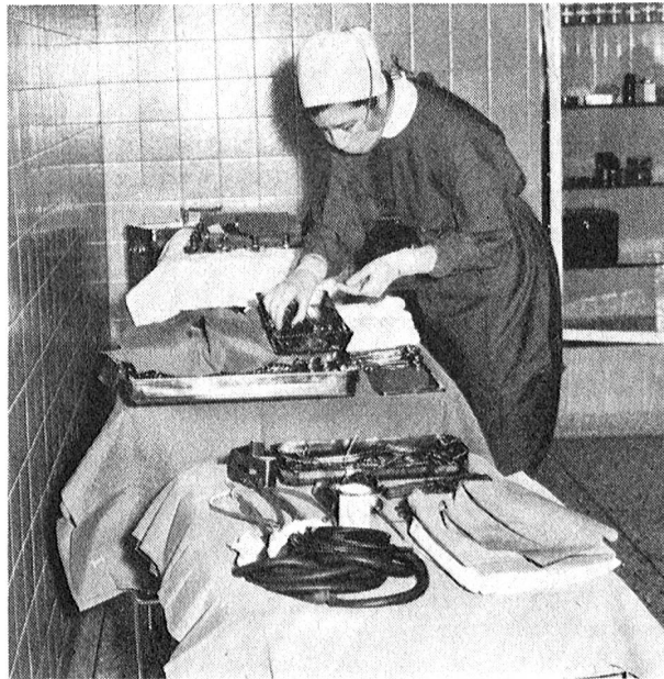
La préparation d'une table d'instruments chirurgicaux, diverse pour chaque intervention, nécessite de 15 à 30 minutes. C'est à l'infirmière instrumentiste qu'incombe le soin de prévoir les instruments dont le chirurgien aura besoin.

— Maintenant, nous comprenons vraiment l'opération, nous savons scientifiquement pourquoi nous devons faire tel ou tel geste, observer telle ou telle précau-