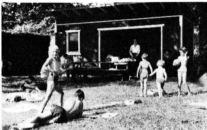
Une coquette baraque, installée par la commune a remplacé le modeste pavillon des débuts.

Ils ont en général de 5 à 12 ans. Ils se baignent, s'amuse, se chamaillent un peu, épuisent les réserves de pansements rapides et de Mercurochrome de la pharmacie.