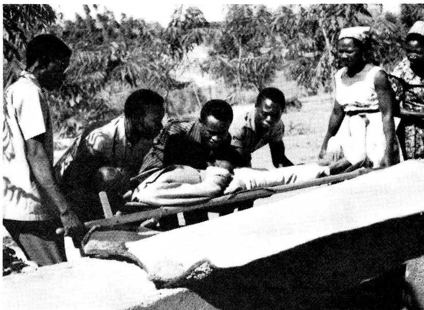
Exercice de premiers secours.

Pour répondre à une demande émanant du Comité provisoire de la Croix-Rouge du Népal nouvellement constitué, la Ligue a pu s'assurer le concours du Secrétaire général de la Croix-Rouge éthiopienne qui s'est rendu à Kathmandu au mois d'avril 1964 pour y étudier les questions que posent l'organisation et le développement d'une Société nationale conforme aux conditions particulières du pays.