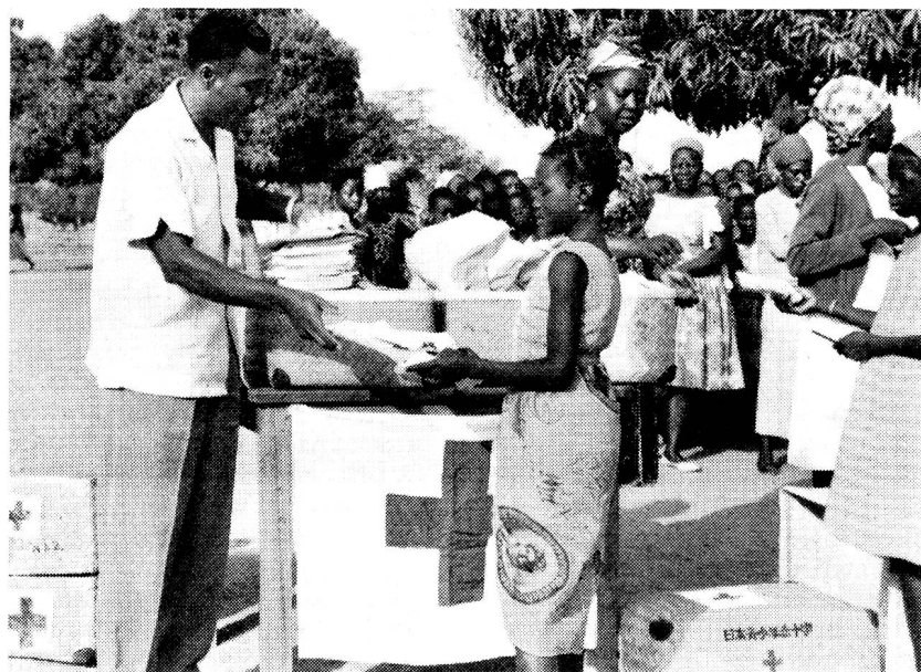
Distribution aux enfants des écoles d'objets divers provenant de la Croix-Rouge japonaise.