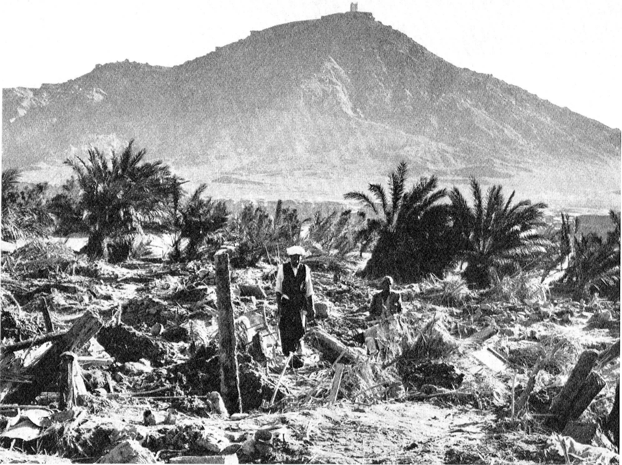
A Erfoud, petite ville cachée dans l'oasis, les débordements du fleuve Ziz ont détruit en quelques minutes 1299 habitations. Tout un quartier de la localité n'est plus qu'un champ de ruines.

comme des îles dans la mer. Après Midelt, chef-lieu de district, la route remonte jusqu'au Col du Talghemt, à 1947 mètres. Nous sommes déjà dans le Haut-Atlas. La route longe la gorge profonde d'une rivière. A l'horizon, pas une hutte, pas un troupeau, rien. C'est le silence, la solitude.