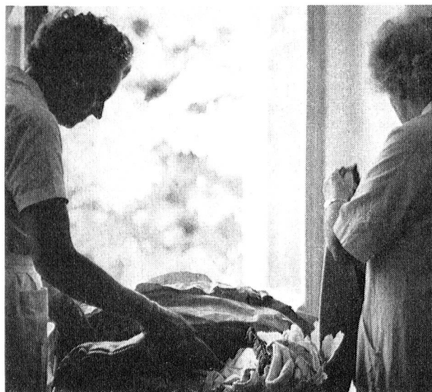
Le tri des vêtements usagés adressés aux sections de la Croix-Rouge suisse représente des heures de travail.

Et bien souvent, les collaboratrices des vestiaires de la Croix-Rouge suisse ne se contentent pas de trier les pièces d'habillement reçues. Beaucoup emportent chez elles ce qui doit être lavé, raccommodé, remis en état. Avec du vieux, les plus habiles feront du neuf. D'autres tricoteront. Et toutes, régulièrement, semaine après semaine, reviendront au vestiaire aussi souvent que nécessaire pour accomplir leur activité de « derrière les coulisses ».