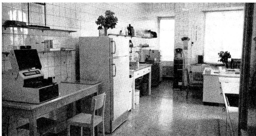
Un des laboratoires du Centre nouvellement installé à la Rue des Arbres.

Rouge suisse, l'on s'efforce non seulement d'obtenir l'adhésion de donateurs de sang de plus en plus nombreux, mais aussi du développement scientifique de cet important champ de la médecine moderne que représente l'hémothérapie.