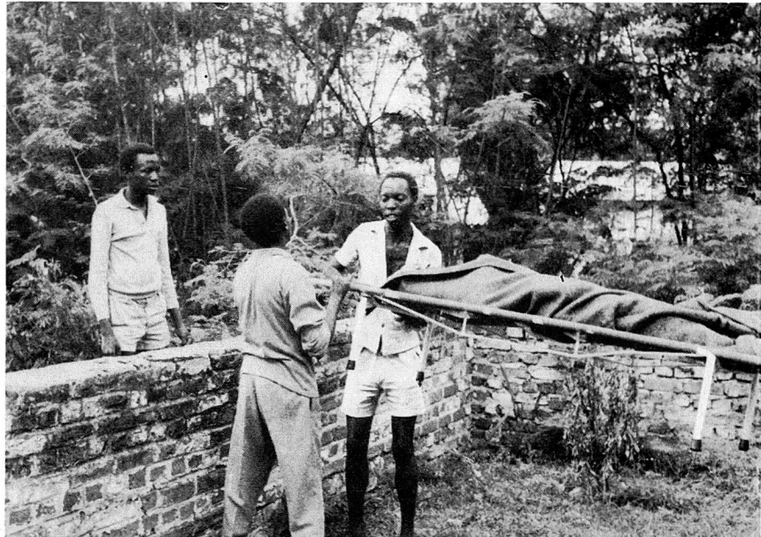
Exercice de transport de blessés par des élèves d'une école normale