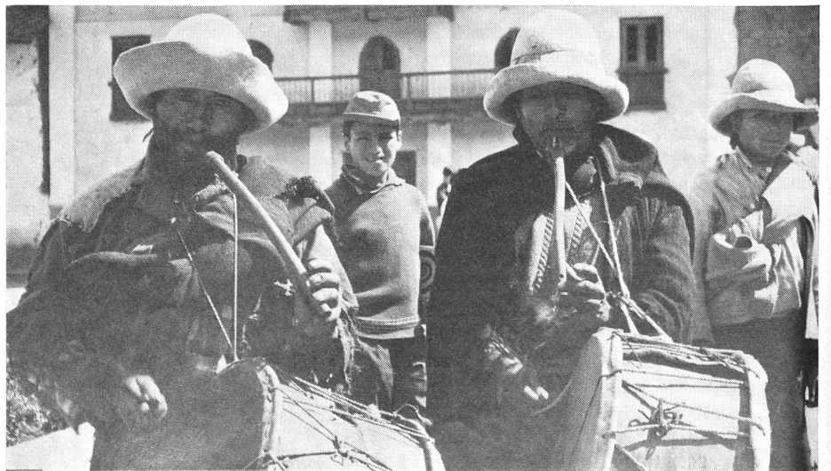
Les musiciens du village soutiennent l'ardeur au travail des ouvriers.

Le soir, une fête fut organisée en notre honneur. On échangea des toasts; à tour de rôle, les gens venaient s'asseoir près de nous, ressemblaient leur anglais scolaire et nous parlaient de la chère Suisse, nous posaient des questions à son sujet, nous enseignaient des danses péruviennes et buvaient derechef à notre santé. Vers minuit, Monsieur Steiner obtint d'un paysan la promesse de mettre dix ânes à disposition pour transporter des caisses au chantier. Plus tard, l'architecte