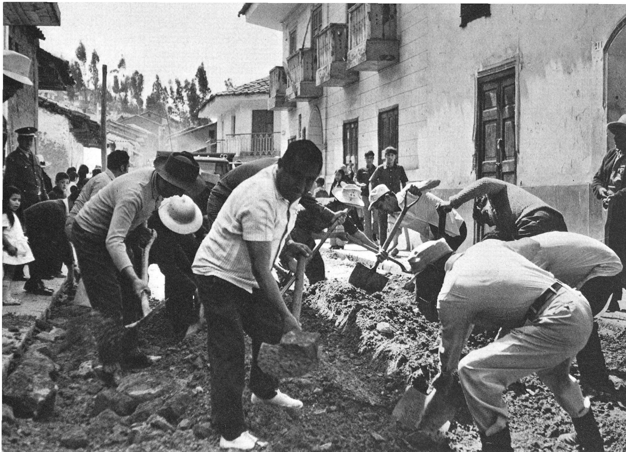
Réfection de la grand-rue à Pomabamba: le matin, les citadins mettent aussi la main à la pâte...

Armas» du petit Piscobamba. En un quart d'heure, tous les notables étaient rassemblés. Ils saluèrent avec une extrême cordialité Monsieur Steiner, qu'ils connaissaient déjà et nous adressèrent également maintes paroles de bienvenue.