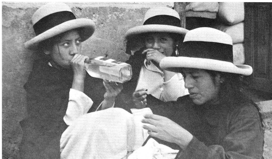
Un dimanche à Pomabamba: le seul plaisir, l'alcool...

La fanfare municipale allait aussi d'un groupe à l'autre. Elle joua le même morceau toute la journée, mais les ouvriers ne s'en plaignaient pas. Il fallait les voir pendant les pauses de la musique! Le premier allait bientôt s'étendre, puis le deuxième, le troisième, et en moins de deux minutes, le travail cessait, pour reprendre aussitôt que les instruments recommençaient. Toutes les heures, un enfant apportait un lourd récipient rempli d'eau-de-vie de maïs. Sans hâte, les paysans s'alignaient et chacun en