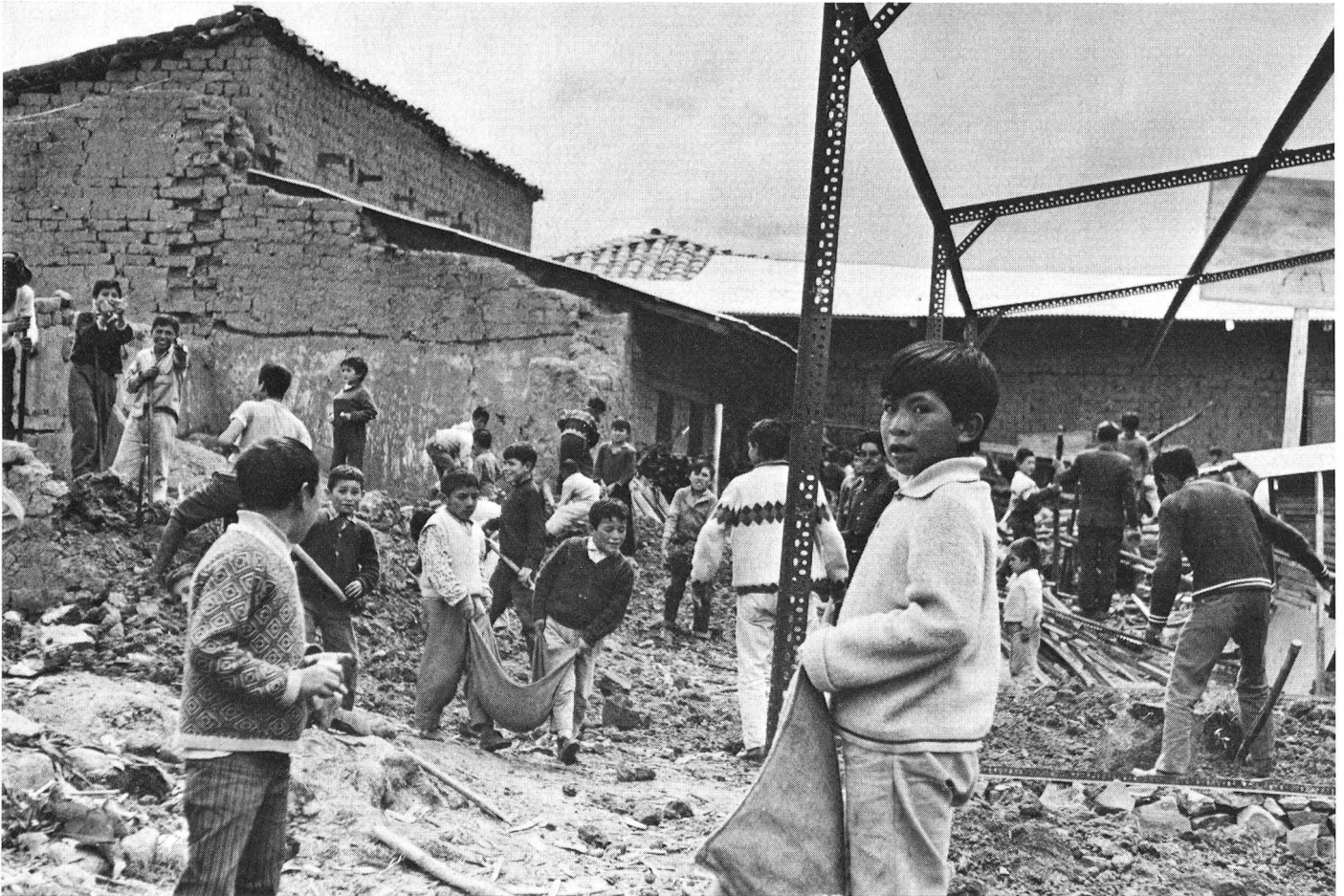
Les petits écoliers de Piscobamba déblaient les ruines de leur école et vont aplanir le sol de la nouvelle construction.

recevait sa part, le même verre servant pour tous.