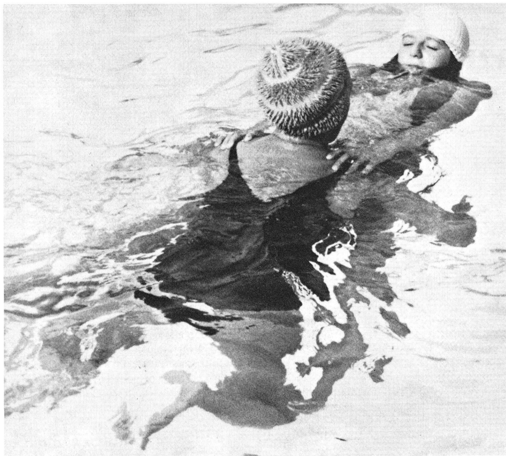
La monitrice impartisce la prima nozione del salvataggio in acqua.